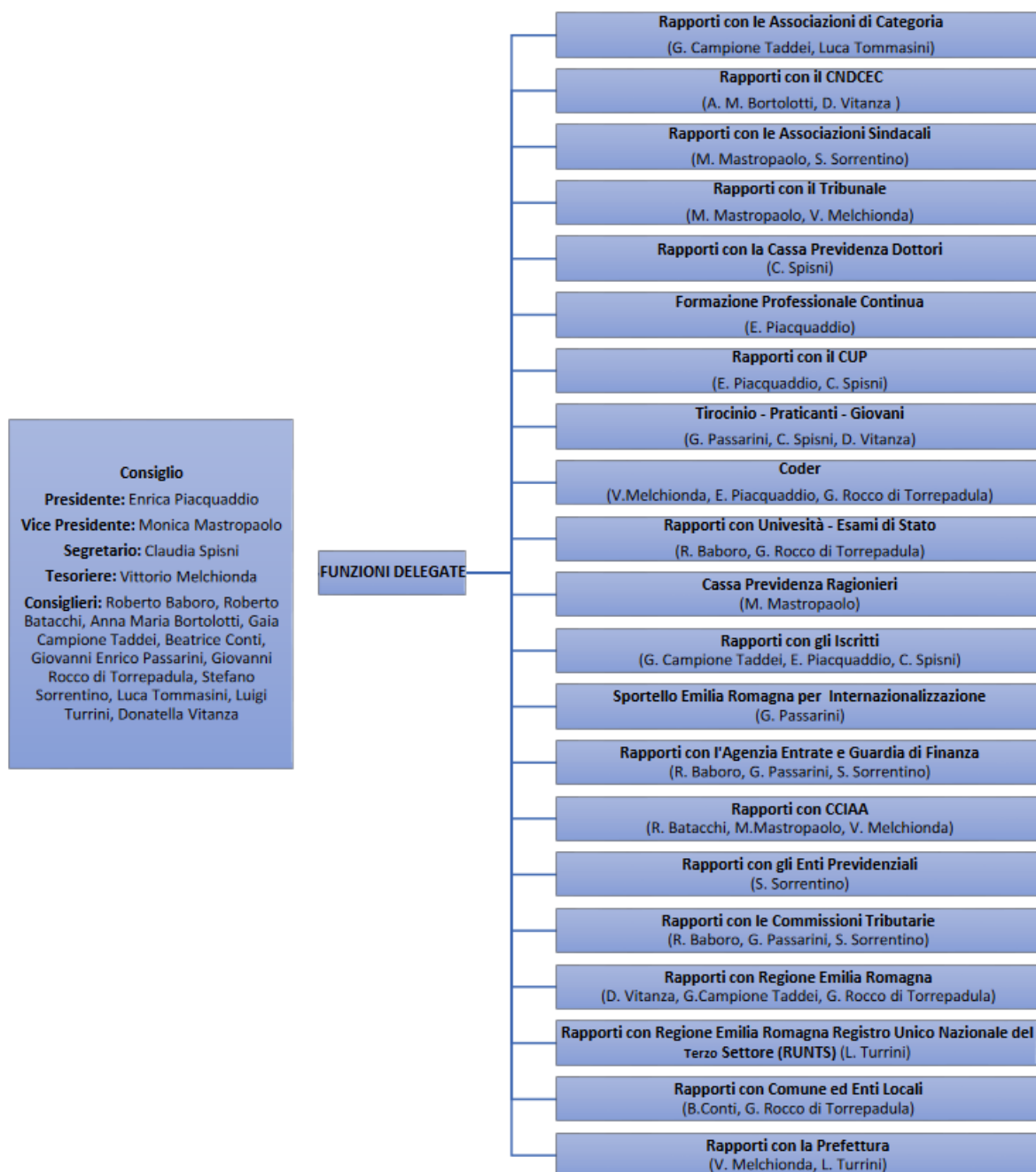
Figura 2 - Organigramma del Consiglio

Ordine dei Dottori Commercialisti e degli Esperti Contabili di Bologna