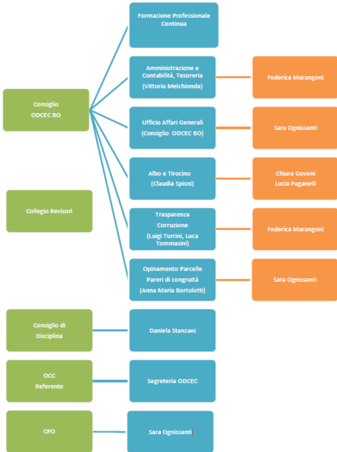
Figura 1 - Organigramma dell'Ordine dei Dottori Commercialisti e degli Esperti Contabili di Bologna.

Ordine dei Dottori Commercialisti e degli Esperti Contabili di Bologna